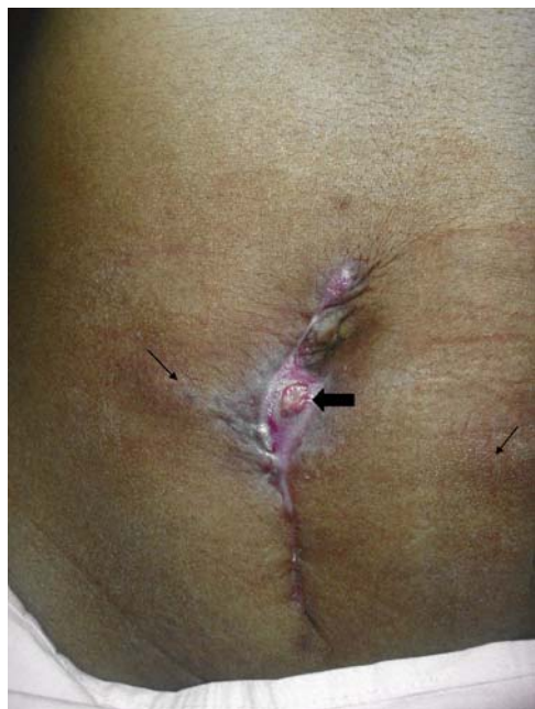
Figura 1. Imagen clínica inicial donde se aprecia la cicatriz quirúrgica, en el centro de ésta una goma –flecha negra gruesa– con superficie erosionada con secreción seropurulenta y dos nódulos (uno a cada lado) –flechas negras delgadas– con trayecto linfático.

La esporotricosis es una infección micótica subcutánea que ha sido reportada prácticamente en todos los estados de la República Mexicana, el estado de Guerrero tiene en sus