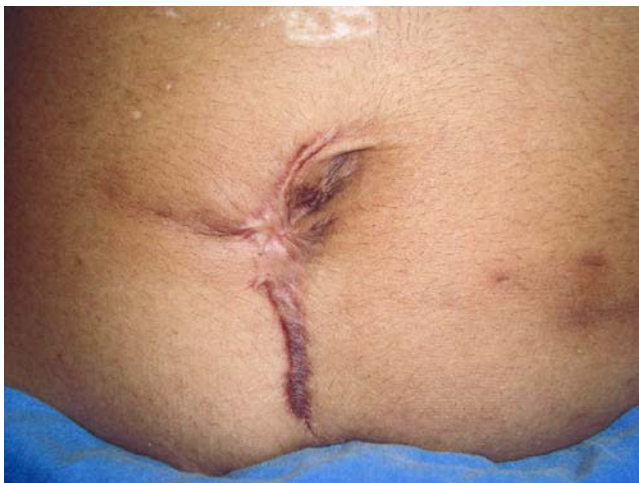
Figura 4. Imagen clínica posterior a tratamiento con seis meses con itraconazol sistémico 300 mg diario.

La inoculación traumática que en el caso presentado fue con espina de nopal, es parte de las diversas estructuras descritas como fuentes de introducción en la piel de este hongo y también deben considerarse lesiones cutáneas ocasionadas por plantas secas, paja, espinas de rosales, vidrios e incluso ocasionadas por animales como son mordeduras de rata, armadillos y picaduras de insectos, de hecho en algunas descripciones extranjeras se considera como probable inoculación traumática para la afección abdominal el contacto con gatos. 7,8